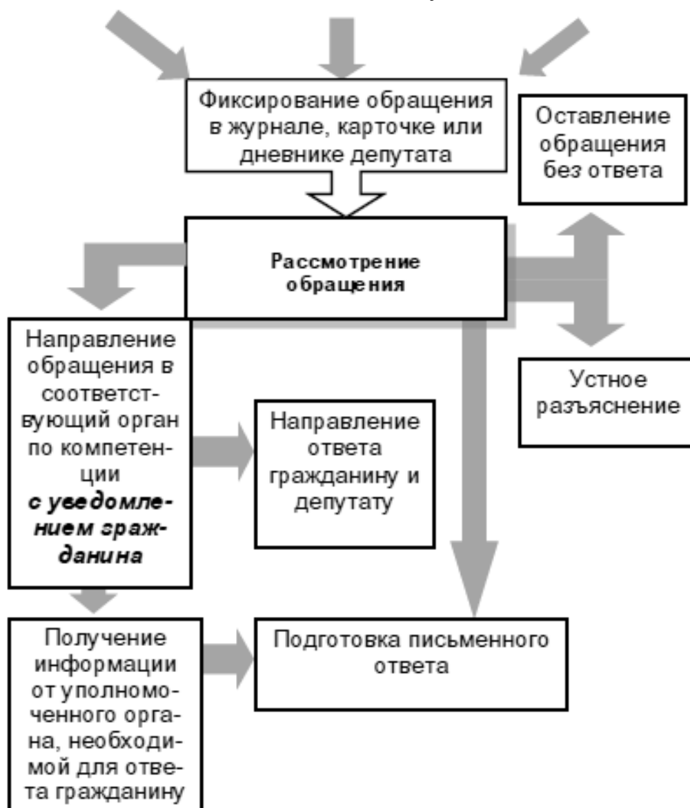
Рис. 5. Рассмотрение обращений граждан депутатами

Обращение может быть направлено или переадресовано депутатом в компетентный орган, который рассмотрит данное обращение по существу. Кроме этого, данный компетентный орган обязан информировать гражданина - заявителя и депутата об итогах рассмотрения обращения. О факте переадресации обращения гражданин должен быть обязательно уведомлен.