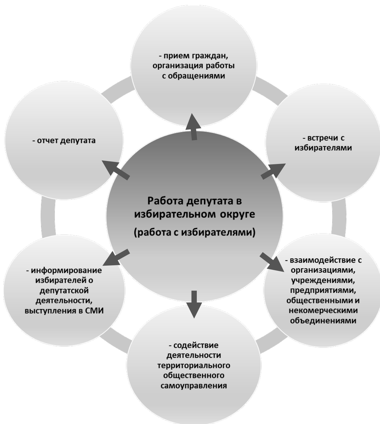
Рис. 4. Формы работы депутата представительного органа муниципального образования в избирательном округе

Другое направление деятельности депутата представительного органа муниципального образования осуществляется депутатом в избирательном округе, с избирателями и также сочетает в себе различные формы. Схематично это можно представить следующим образом (рис. 4).